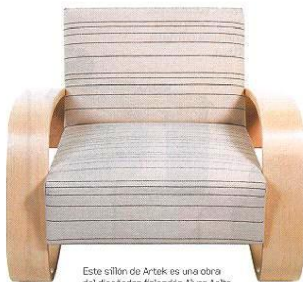
Este sillón de Artek es una obra del diseñador finlandés Alvar Aalto.

Y si en vez de la gran pantalla te va la tele, lo más visto se llama Madventures, un programa en el que dos tipos recorren el mundo en busca de las costumbres más excéntricas ( www.madventures.tv ). Por último, te descubrimos el "avantouinti", pero tendrás que esperar a que algún finlandés te invite a probarlo. Consiste en pasar de la sauna a un lago congelado.