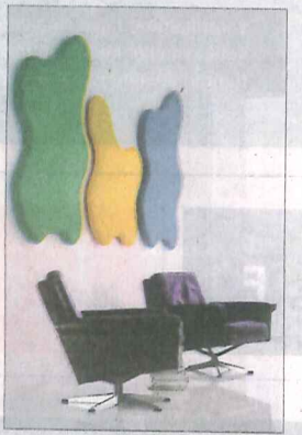
Huopamaisella kankaalla verhoillut Wannabtree-paneelit on suunniteltu toimistoihin. Sisäillä on mdf-levy ja polyesterivanua. Pleinin on kooltaan 107 x 114 senttiä, ja se maksaa 1 178 euroa villahuopakankaalla verhoiltuna. Kinnarps.