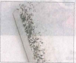
Vanerin päälle liimattu ryijypinta poistaa kaikua pienessäkin tilassa. Ryijytaulu Ada on 40 x 100 senttiä, hinta 140 euroa. Samasta materiaalista tehdään myös koristetyynyjä. Musiikin.com.