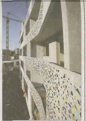
Arabian tehtaan kuppien ja lautasten palaset Flooranaukion asuintalossa kertovat paikan historiasta.