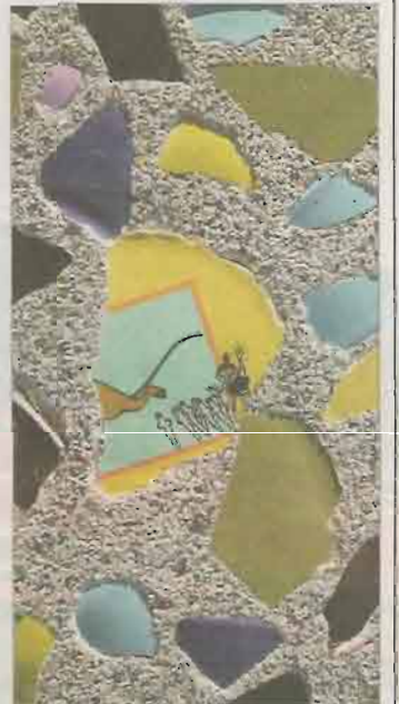
Seinässä on pala Muumimukia.